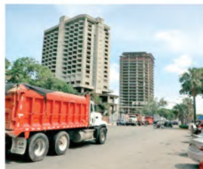
Vehículos pesados no podrán circular. F.E.

La restricción establecida abarca toda la avenida George Washington (Malecón de Santo Domingo) y la Autopista 30 de Mayo (Paseo Marítimo), en el tramo comprendido desde el puerto de Santo Domingo hasta el distribuidor de la avenida Luperón. ● elCaribe