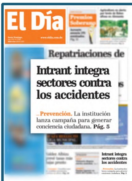
El Día, portada y pag 05, edición impresa 29-01-2025