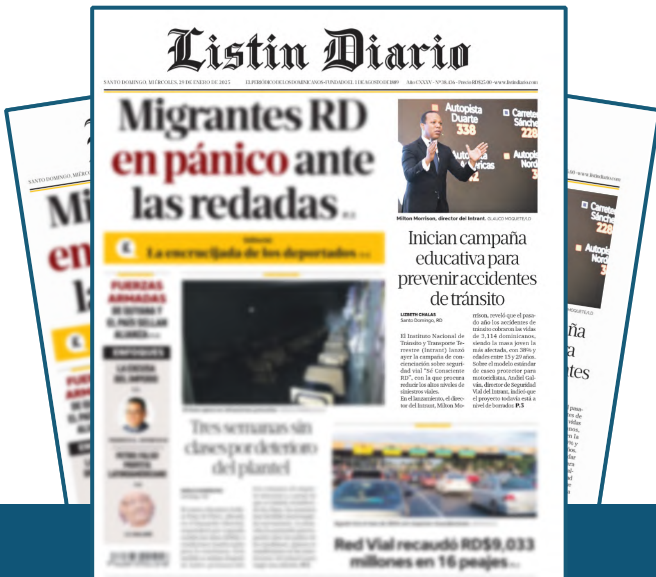
Listín Diario, portada, edición impresa 29-01-2025