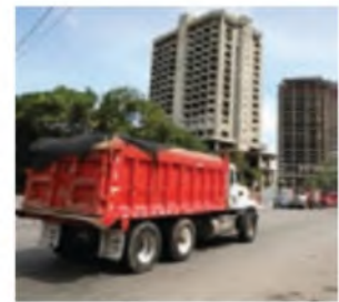
La medida busca prevenir accidentes de tránsito.

El Intrant y la Alcaldía del Distrito Nacional prohibieron a partir de hoy la circulación de vehículos de carga de dos ejes o más por el malecón desde el puerto de SD hasta la avenida Luperón. —