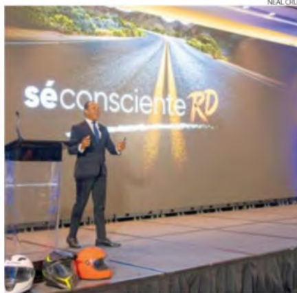
Morrison explica la campaña para evitar los accidentes.

En el caso del Distrito Nacional, Morrison informó que se aplicará la ordenanza 2-2017 del Concejo de Regidores que prohíbe el tránsito de vehículos pesados por la avenida George Washington. Manifestó que pronto los agentes de la Digesett no tendrán que hacer fiscalizaciones con libretas, como ahora, sino que habrá un dispositivo que les permitirá digitalizar las multas. “Ya esas libretas, donde se le anota a usted la multa, eso va a desaparecer. Ya los agentes de Digesett tendrán aparatos que podrán poner las multas y ahí mismo emitirle un recibo y estarán conectados a un sistema que, inmediatamente, va a dar