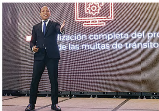
Morrison dijo relanzan la educación vial.