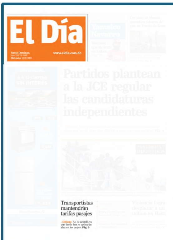
El Día, portada, edición impresa 15-01-2025