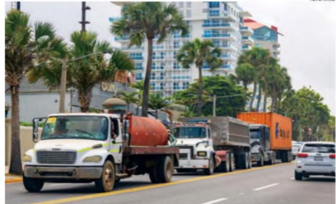
Camiones transitan por el Malecón en violación a la ordenanza 2-2017, del Distrito Nacional.

Los permisos de circulación en el área restringida solo se otorgarán en horario de 9:00 de la mañana hasta las 4:00 de la tarde de manera presencial en la Alcaldía del Distrito Nacional.