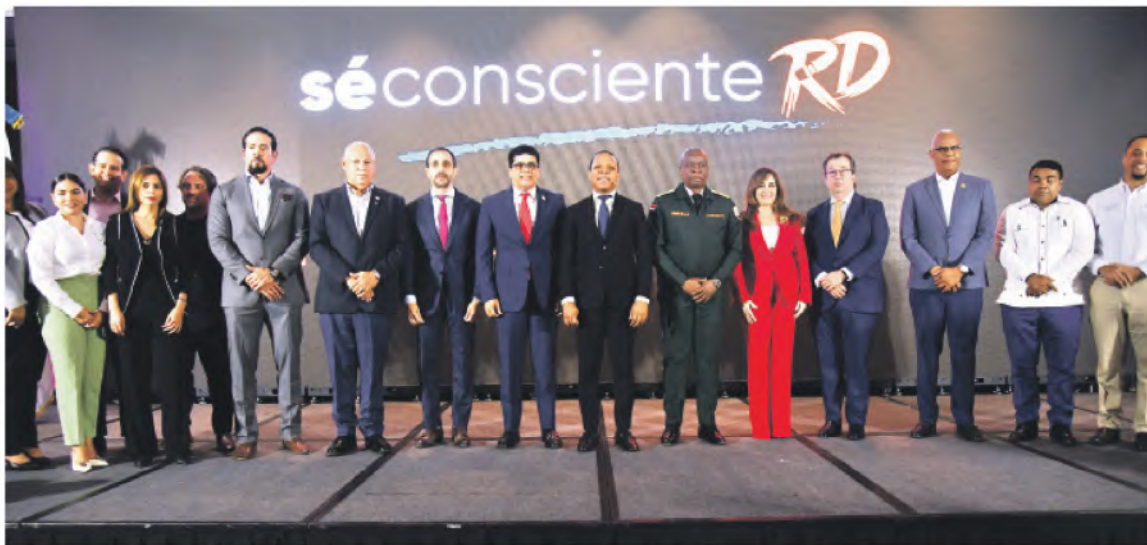
La campaña de prevención fue iniciada ayer para tratar de reducir los siniestros viales que cada años provocan miles de muertes. GLAUCO MOQUETE

“Es un proceso de construcción de un borrador; se va a crear una mesa de trabajo donde vamos a estar en contacto con los expertos que nos van a estar guiando, y al final con el Indocal, que tiene su proceso para certificar en términos de calidad cualquier pro-